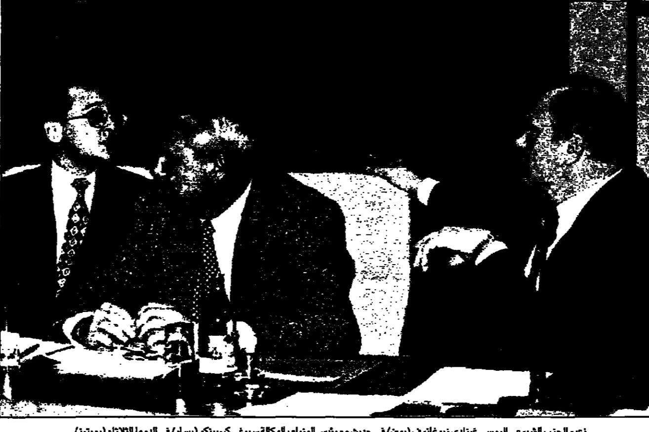
زعيم الحزب الشيوعي الروسي غيدان زيوغلافوف (يمين) في حديث مع رئيس الوزراء بالوكالة سيرغي كيرينكو (يسار) في الدوما الثلاثاء

فوز كوتشاريان برئاسة ارمينيا فوز كوتشاريان برئاسة ارمينيا. فوز كوتشاريان برئاسة ارمينيا.